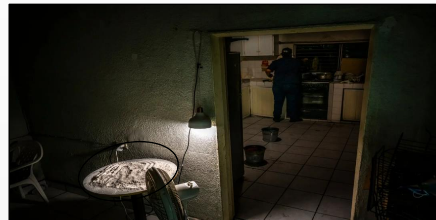
Imagen 1: "Polvo blanco, supuestamente fentanilo terminado, en una mesa a la izquierda".

Imagen 3: Se observa HNI incorporando la tinta azul al supuesto producto terminado (fentanilo), esta vez, utilizando guantes de látex . El uso de la tinta azul confiere el color característico de los comprimidos de fentanilo , alusivas a las tabletas de M30 (metadona).