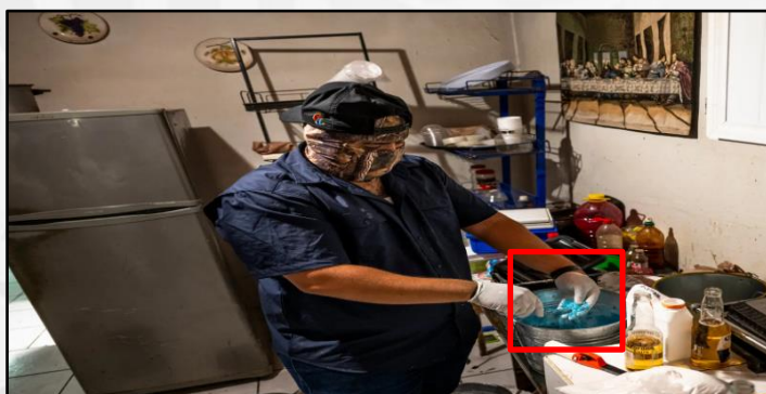
Imagen 3: "Cocinero del Cártel de Sinaloa masajeando tinta azul en una cubeta de polvo de fentanilo".