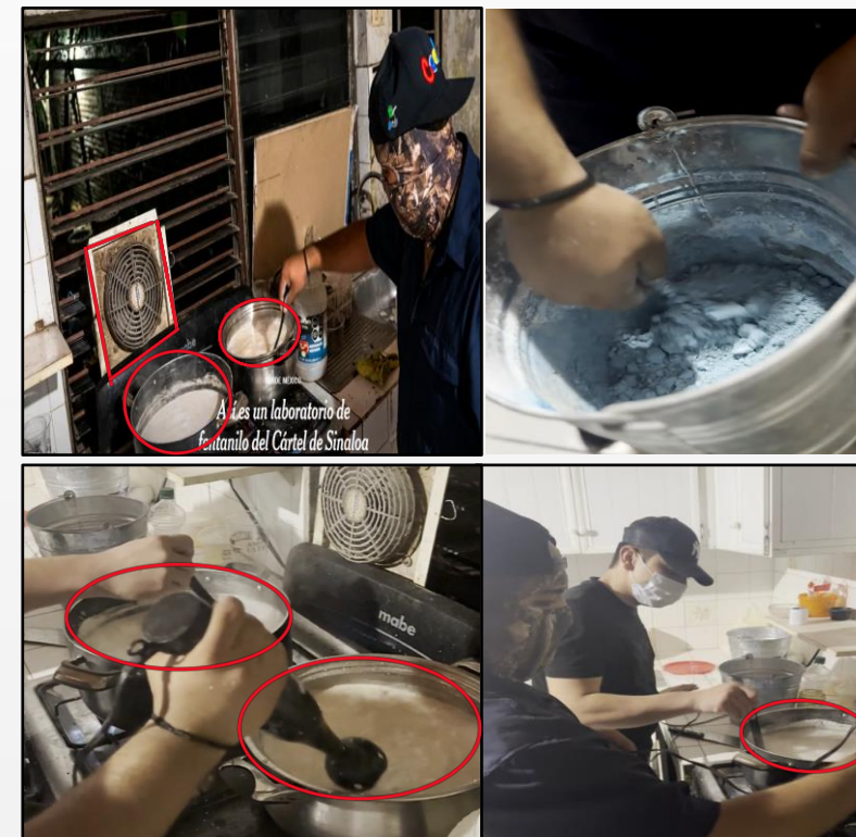
Imágenes extraídas de los videos analizados. ( The New York Times , 2024)