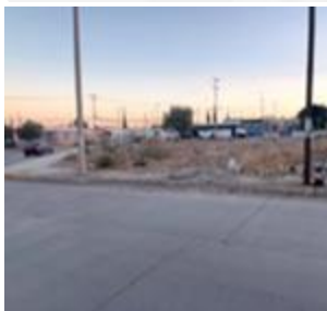
Colonia Municipio Libre