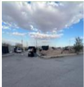
Fraccionamiento Las Gladiolas, Etapa II

5 CECI IMSS DE PRESTACIÓN DIRECTA 5 predios donados por el municipio 1,110 lugares