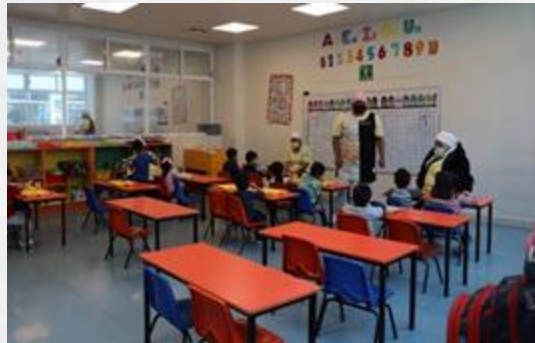
Mejor diseño pedagógico