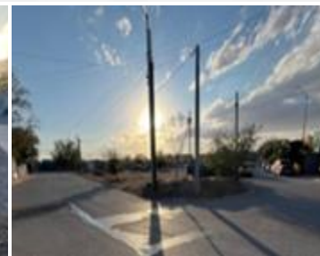
Fraccionamiento Senderos de San Isidro, Etapa VIII