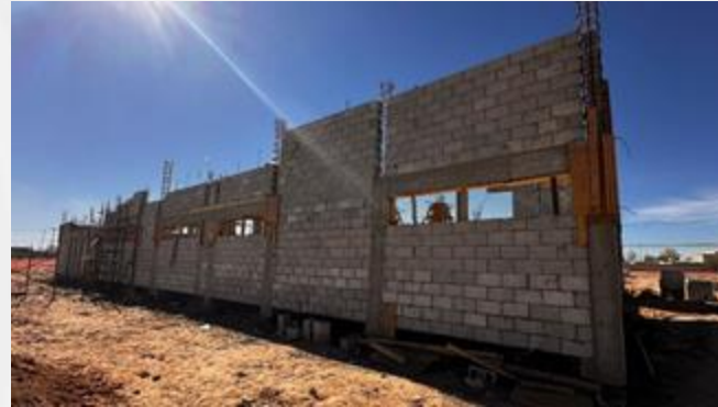
Menor tiempo de construcción