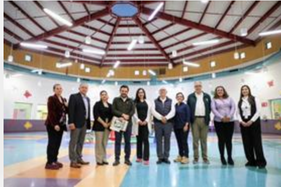
Uso eficiente del espacio