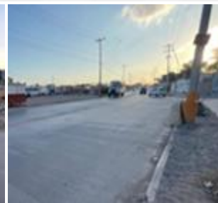
Fraccionamiento Paraje de Oriente 17