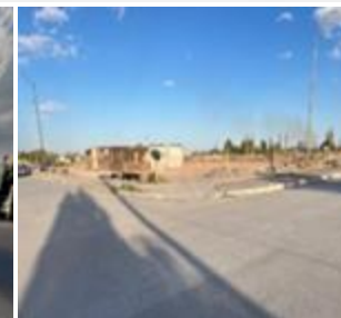
Fraccionamiento Urbivilla del Cedro, Sección IV, Etapa 10