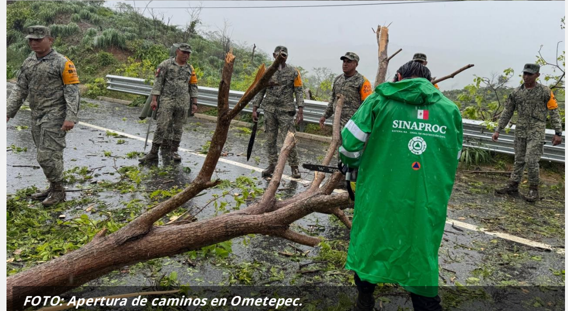
FOTO: Apertura de caminos en Ometepec.