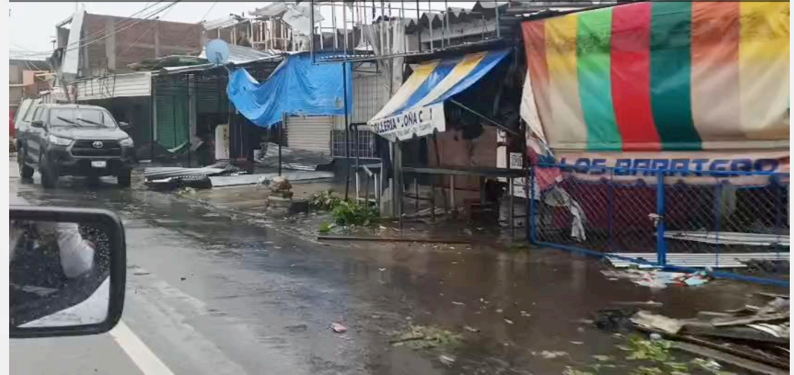
VIDEO: Recorrido en Cuajinicuilapa.