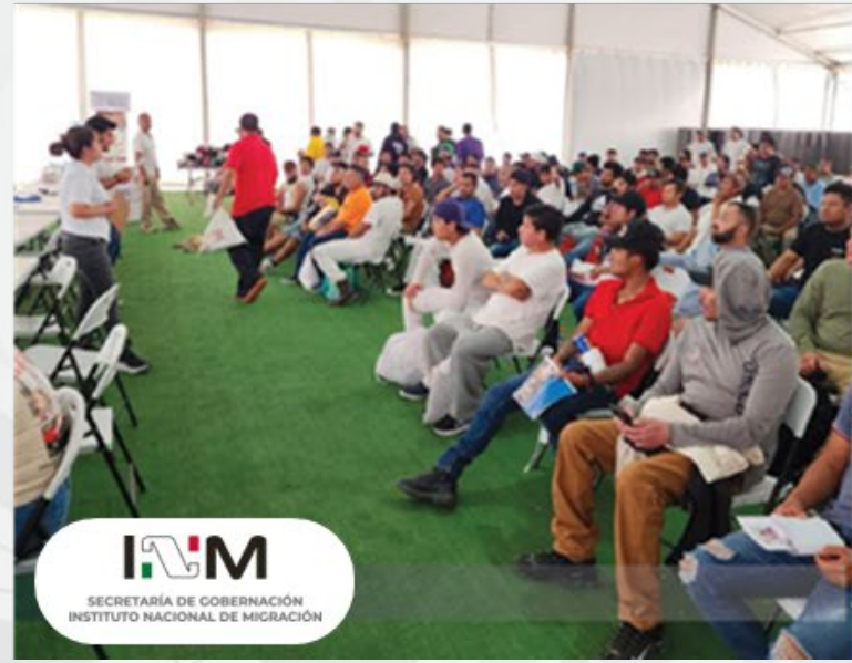
I/M SECRETARÍA DE GOBERNACIÓN INSTITUTO NACIONAL DE MIGRACIÓN