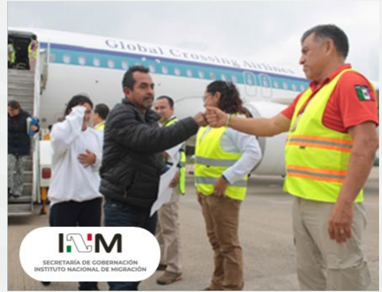
I/M SECRETARÍA DE GOBERNACIÓN INSTITUTO NACIONAL DE MIGRACIÓN