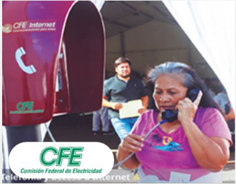
CFE Comisión Federal de Electricidad