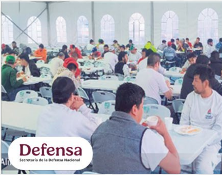
Defensa Secretaría de la Defensa Nacional