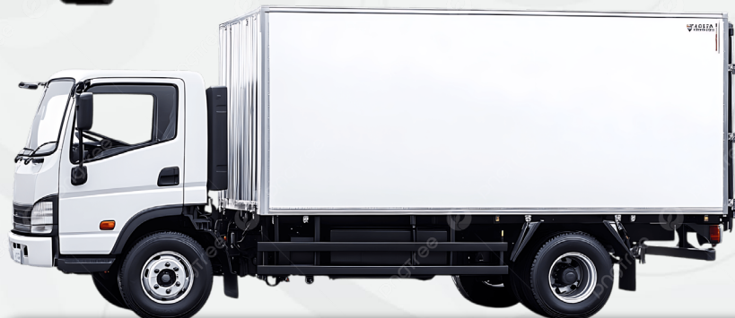
Camiones de carga