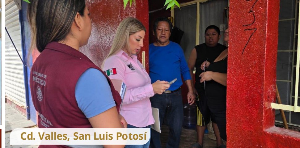
Cd. Valles, San Luis Potosí