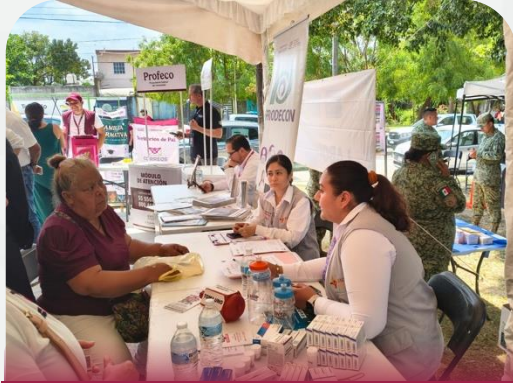
San Luis Potosí