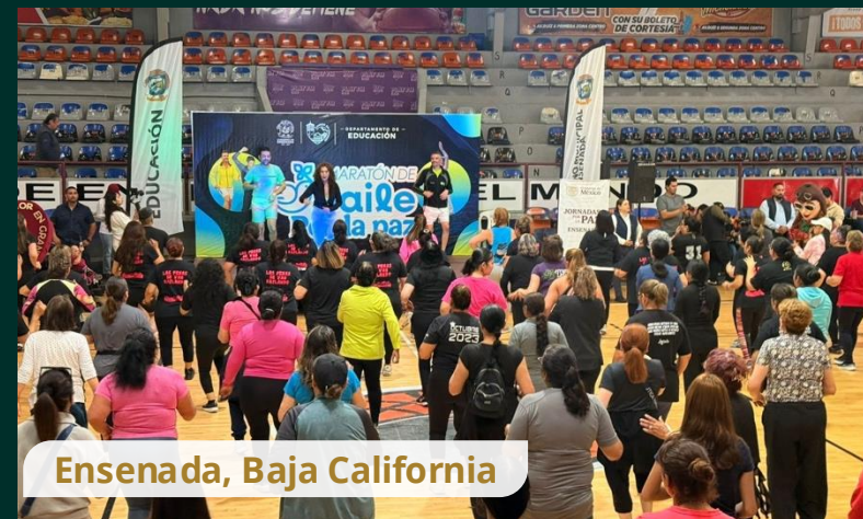
Ensenada, Baja California