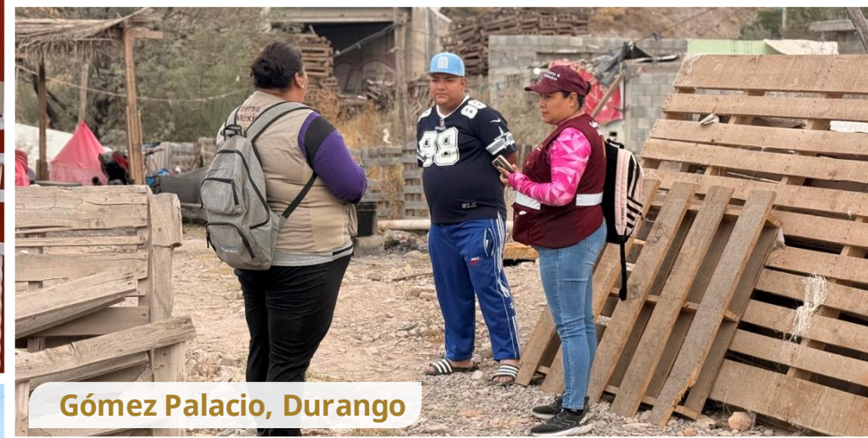
Gómez Palacio, Durango