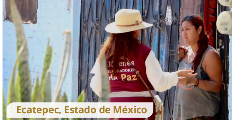
Ecatepec, Estado de México