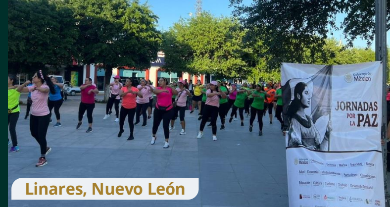
Linares, Nuevo León