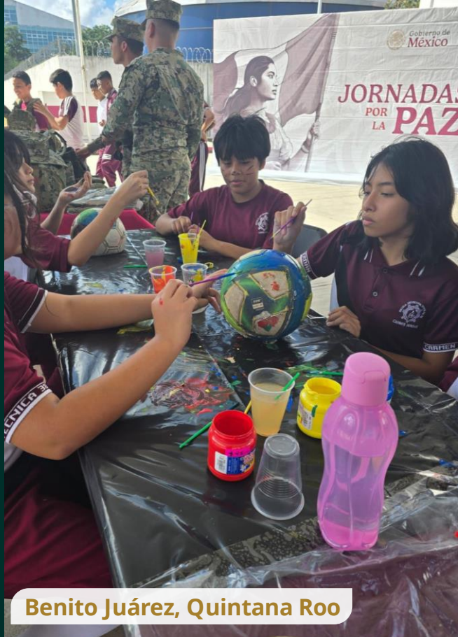
Benito Juárez, Quintana Roo