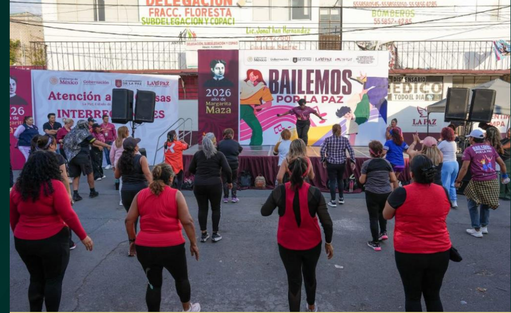
La Paz, Estado de México