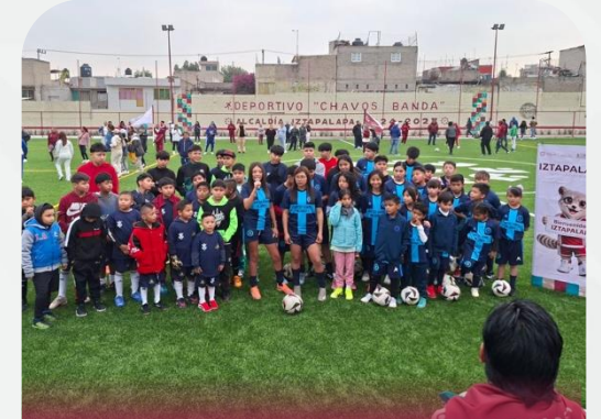
Ciudad de México