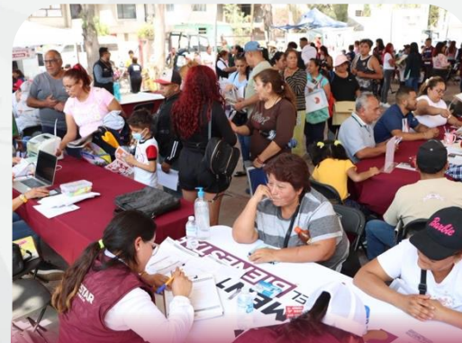
Estado de México